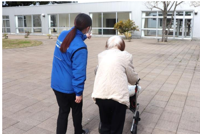
ご自宅や施設までお伺いします