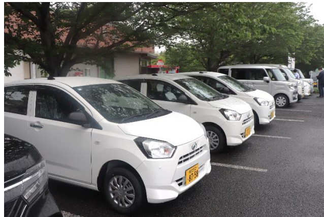
中央3台がミラ・イース

当院は地域包括ケアシステムの中核病院として、訪問診療や訪問看護、訪問リハビリテーションなど、在宅医療に力を入れております。訪問用車両の増強により、これまでより一層、地域の皆様のところへお伺いしやすくなりました。